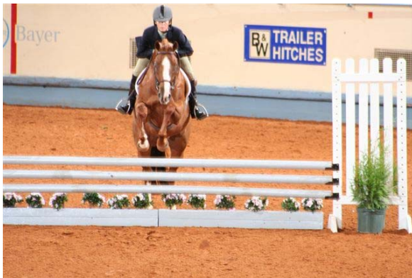
American Quarter Horse i aksjon

Organisasjonen har i dag registrert mer enn 5 millioner Quarterhester, og har mer enn 350.000 medlemmer over hele verden. Bare i 2007 ble det registrert mer enn 137.000 nye hester, og dette befester Quarteren's posisjon som verdens mest populære hest.