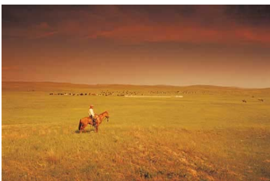
The Wild West

The Wild West Rasen fikk navnet sitt i forbindelse med hesteløp, da man så tidlig som på 1600-tallet tok med seg hester i fra Irland og England for å tilfredsstille kolonistenes interesse for hesteveddeløp. Den er allment godtatt som verdens raskeste hest på en kvart (Quarter) amerikansk mil (402 m), og har blitt målt til hastigheter opp til 55 mph (88 km/t). Etter hvert som pionerene reiste vestover i USA fulgte hestene etter, og i løpet av 1800-tallet dukket det opp stadig flere kvegfarmer i nybyggerområdene. Rasen viste seg å takle utfordringene i Vesten utrolig godt, takket være sitt rolige gemytt og gode evner som arbeids- og gjeterhest.