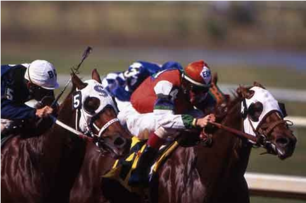
Veddeløp med American Quarter Horse

Det finnes ingen begrensninger på hva slags hesteraser som kan brukes innen western ridning. Skal man delta i konkurranser finnes det derimot begrensninger både med tanke på rase, alder, erfaring etc., men de fleste stevnearrangører tilbyr som oftest all-breed klasser på sine arrangementer. Allikevel bruker majoriteten av westernryttere den amerikanske Quarterhesten i konkurranser – årsaken til dette er at sporten krever en bevegelig, rask og reaksjonssterk hest, noe som nettopp karakteriserer den Amerikanske Quarterhesten.