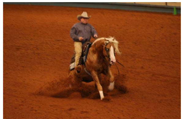
Slide Stop i reining

I reining og cuttingklasser ser man ofte små og kompakte hester med raske bevegelser og et medfødt gjeterinstinkt (cow sense).