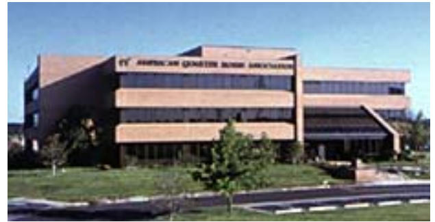
AQHA's Hovedkontor i Amarillo, Texas

For å forsikre seg om at rasens unike kvaliteter ikke forsvant, samlet i 1940 en gruppe American Quarter Horse entusiaster seg i Fort Worth, Texas, og etablerte det som senere har blitt verdens største raseregister, The American Quarter Horse Association (AQHA), som nå har hovedsete i Amarillo, Texas.